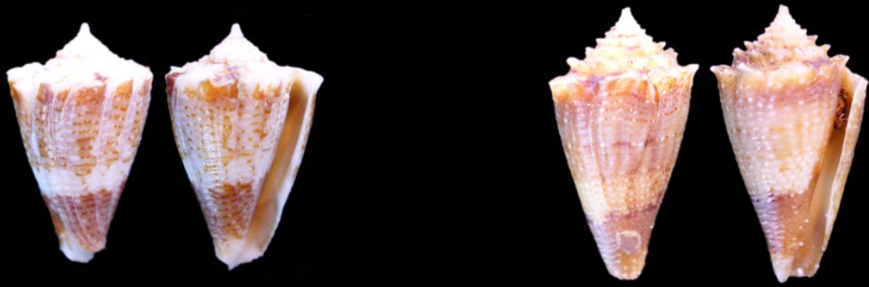
000510/01 Taranteconus chiangi Azuma, M., 1972

018,29mm – IPC – excell. Petruccioli L. - Aliguay, Filippine